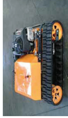
Kompakt, stabil og beregnet til vedvarende brug. Naturligvis med godkendt professionelt udformet fjernstyring.