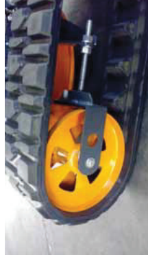
Trækjul og spændehjul i professionel udførelse med stort dimensionerede lejer og afstryger.