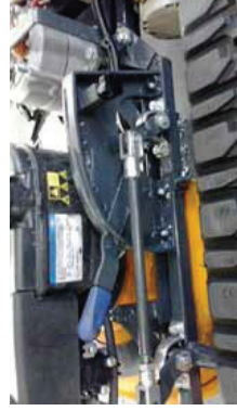
Klippedeindestilling med integreret flydestilling.